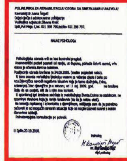
Faksimil nalaza dječjeg psihologa specijalista

za zaštitu svog djeteta uputila Ministarstvu zdravstva i socijalne skrbi, žaleći se, kako navodi, na nepravilnosti u radu omišskog Centra za socijalnu skrb koji je naniogromnu štetu njezinoj kćerki, a time i onemogućio normalan život nje, kao majke. Ona je s djetetovim ocem u listopadu 2009. podnijela sporazumni zahtjev za razvod braka i bila na sudskom ročištu, me-